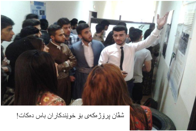
شقان پروژەمكەى بۇ خويىندكاران باس دەكات!

بىسمار، برغو، ماددە پۇلىمەر و شوشەيىھەكان لە ناستىكى ئەندازىيارى پىئويستف، بەلام بە رىژەى جىواز، بۇيە لە تويزىنەمەكەدا دەرگەوت ماددە گەيىنەرەكان كە تاىيەى ئۇتومبىلەكان كوون دەكەن تواناى ھەيە بە رىژەى (۹۹%) پىشانى بەدات كە تاىيەكە كوون كراو، بەلام بە مەرحىك ئەم چىنەى برىبىك كە لە ناو تاىيەكە دامان ناو، بۇ شوشە و پۇلىمەر رىژەمكەى لە (۱۰%) كەمترە .